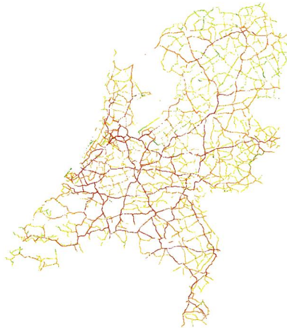
Verdeling inzet mobiele werktuigen onderhoud wegen