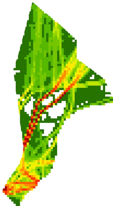
Olietankers: totaal brandstofverbruik (TJ), 5*5km (NCP)